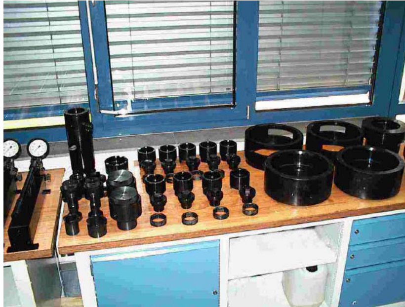
Überprüfung von Schraubenspannvorrichtungen im Kundenauftrag als QS-Maßnahme